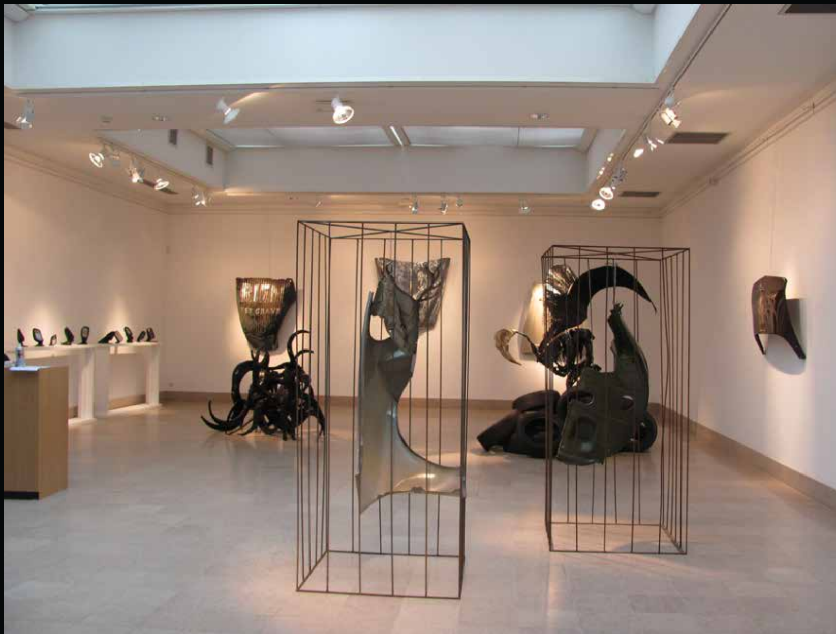
Exposition personnelle de fin de résidence à l'orangerie du chateau de la Louvière, Montluçon. Septembre 2013.