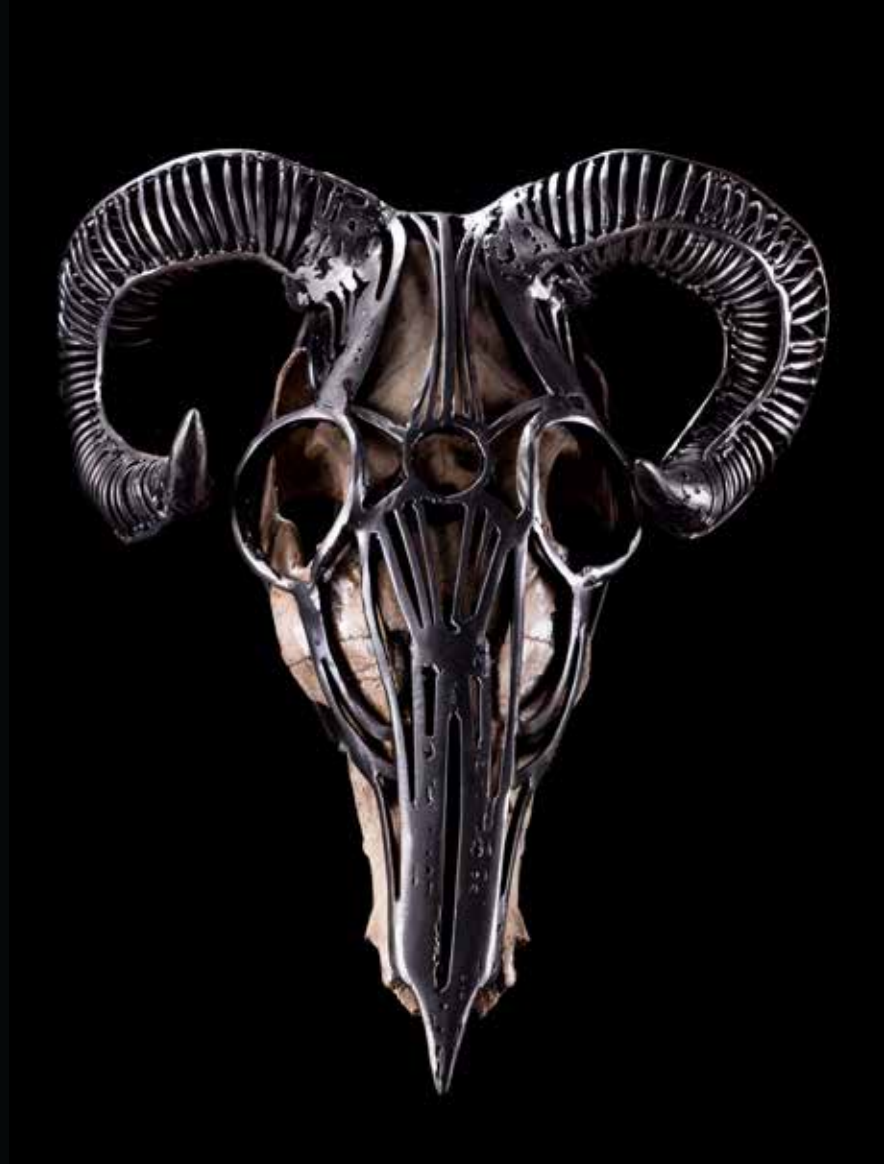
Bél, 2016 Crânes, métal h: 33,5cm l: 31 cm L: 35,5 cm