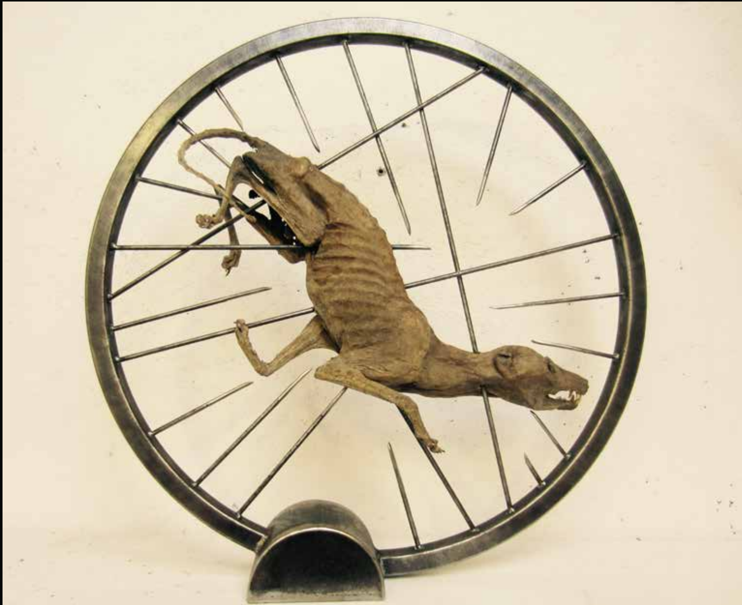
Rouage animal, 2017 Chien momifié, métal Diamètre: 80 cm x 80 cm