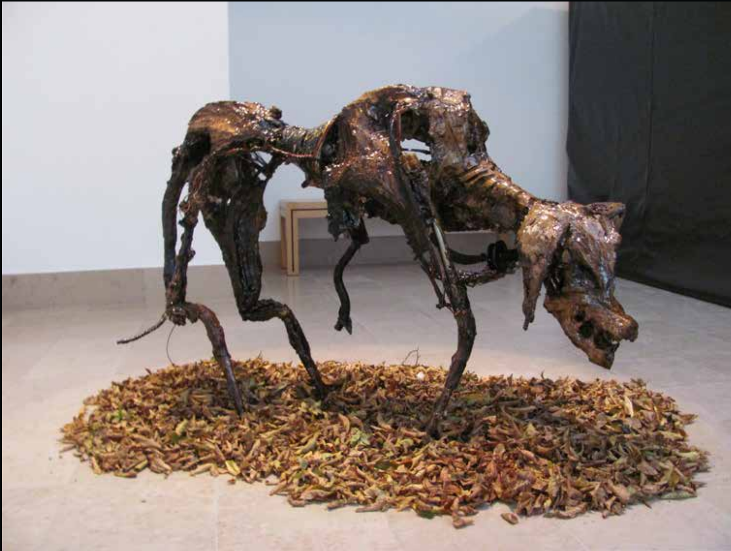
Misty, 2013 Musée de Tessé (Le Mans) Métal, map, goudron, cable h:60 cm l:35 cm L:140 cm