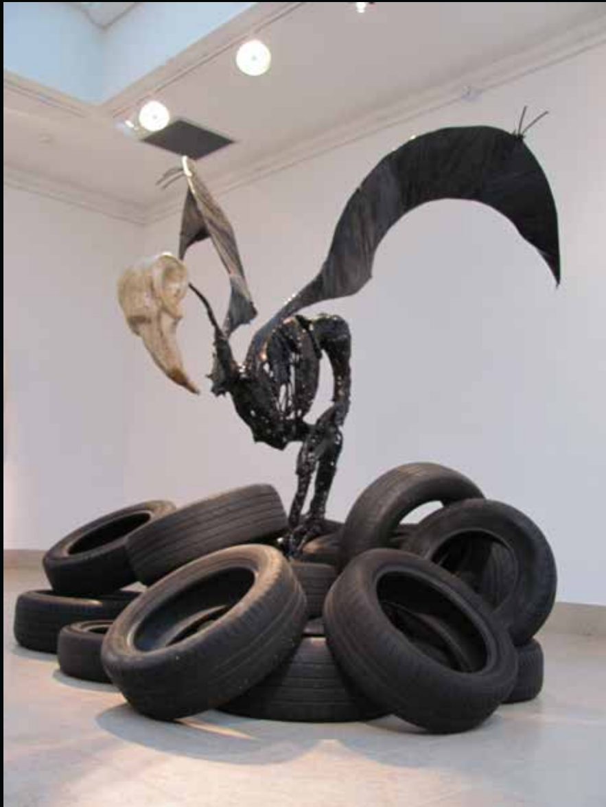
Amoco Cadiz , Sculpture/installation; 2013 envergure: 2,50, hauteur tête: 1,60 Métal, map, goudron, résine, plastique, pneu.