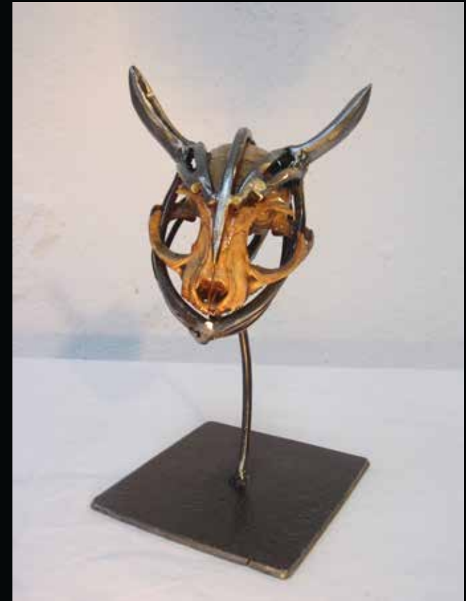
Rituel 1, 2015 h: 20cm, l: 10cm, L: 11cm Collection particulière