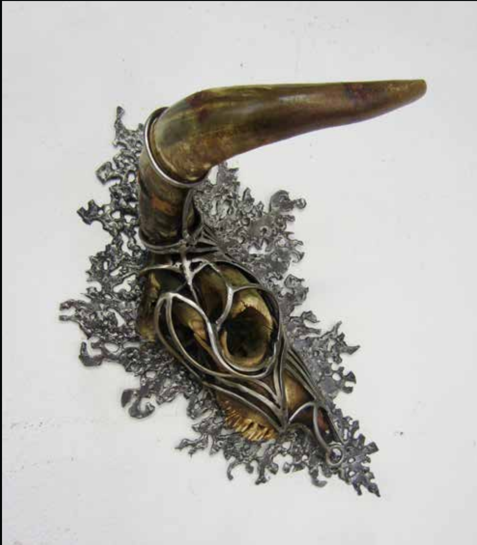
Porcherie, 2017 Crâne, cornes, métal h:25,5 cm l: 31 cm L: 55 cm