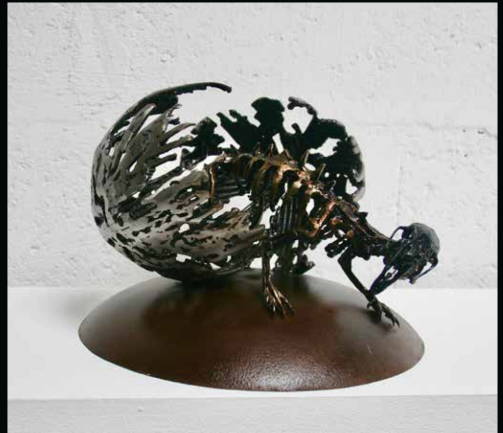
Ecllosion, 2017 Crâne, métal h: 20,5 cm l: 29,4 cm L: 36,9 cm