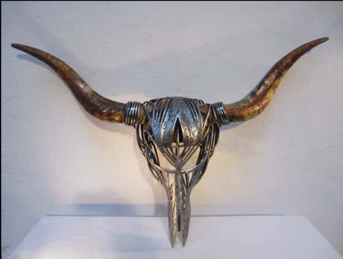
Rituel 2, 2015 h: 54cm, l: 86cm, L: 58cm Collection particulière