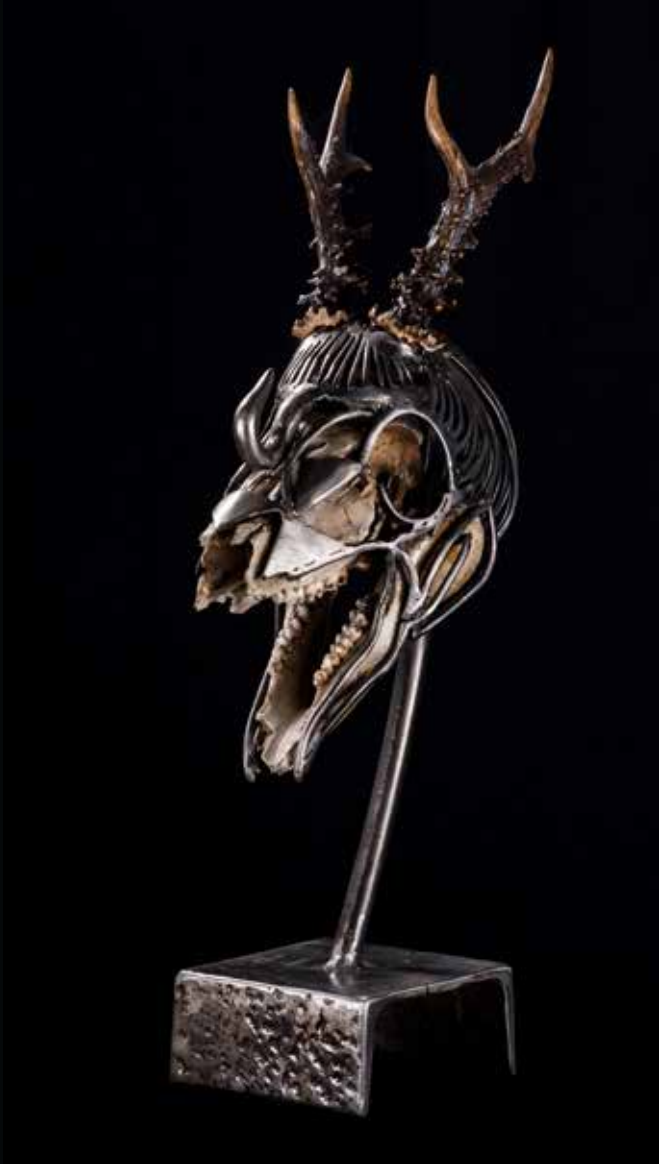
Bagarre, 2016 Crâne, cornes, métal h: 54cm l: 23,2cm L: 48,7cm Collection particulière