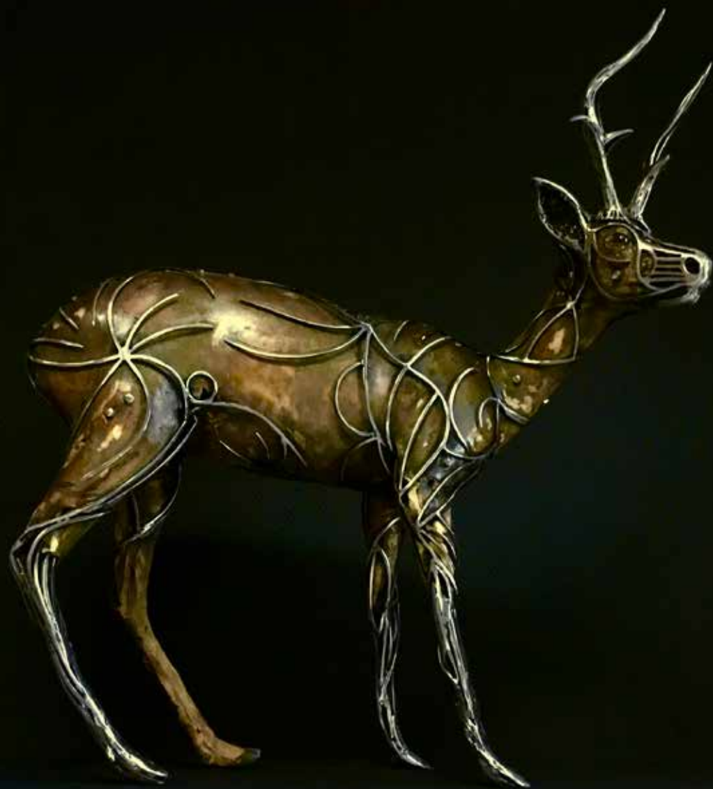
Prothèse, 2017 brocard naturalisé, métal h: 101,5 cm l: 92 cm L: 55 cm Collection particulière