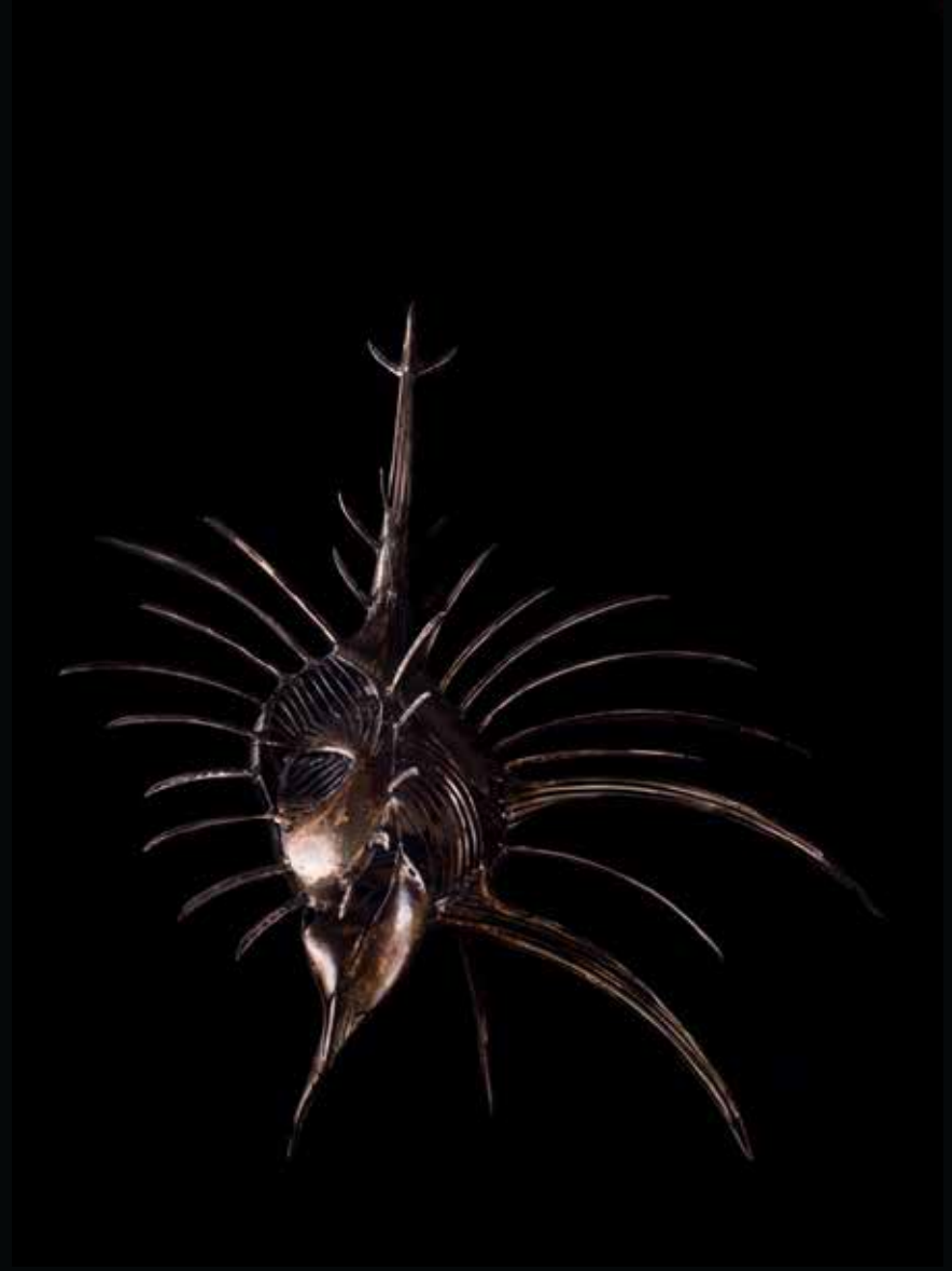
Murex Pecten, 2017 Métal, patine goudron h: 92,5 cm l: 43 cm L: 68 cm