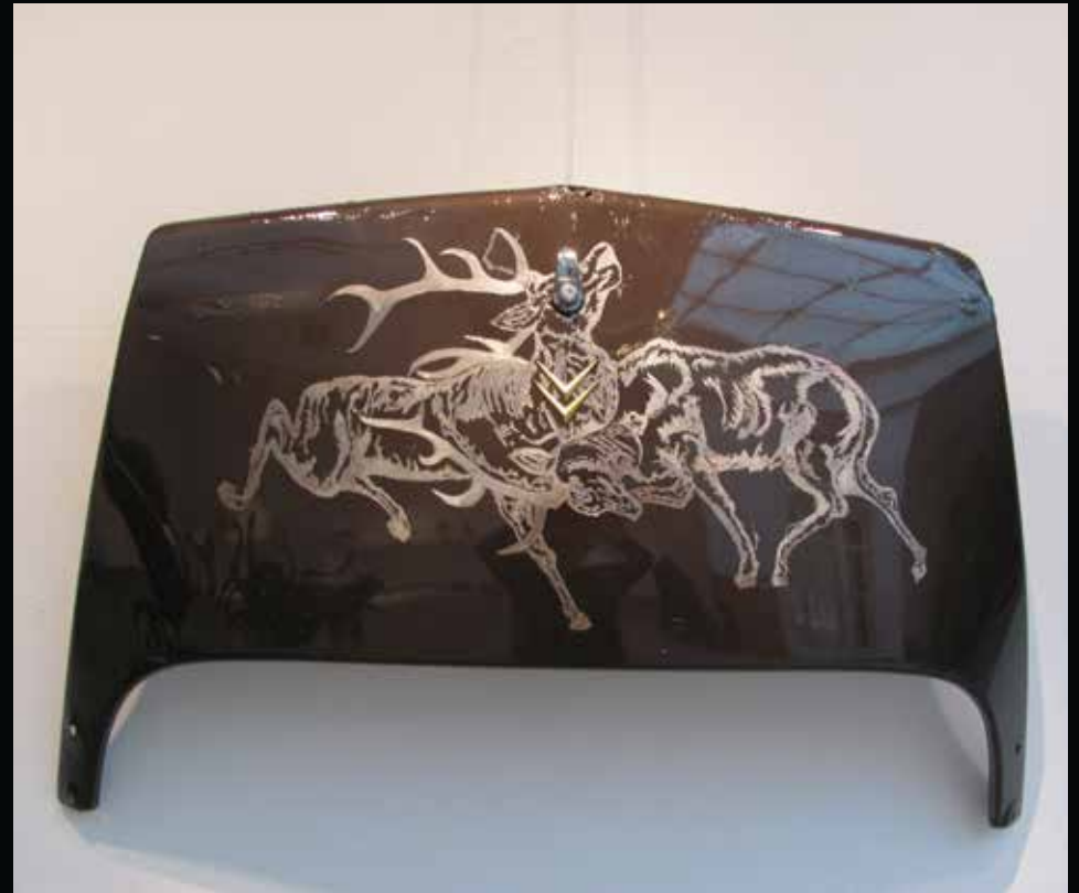
Duel, 2013 échelle 1 gravure sur coffre de DS. Collection particulière