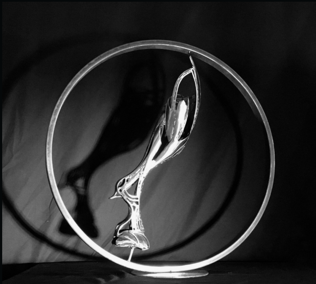
Foulée , 2017 Sabot de cheval, métal Diamètre: 79 cm x 79 cm