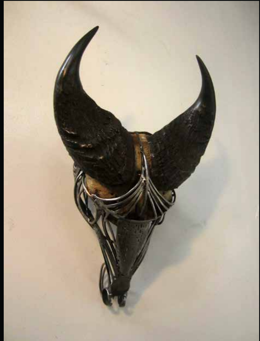
Buf, 2016 Cornes, métal h: 24,5 cm l: 36,2 cm L: 62,2 cm Collection particulière