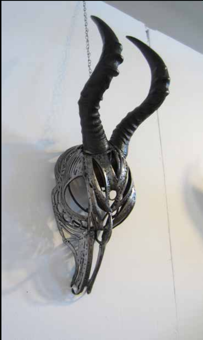
Antilop, 2016 Cornes, métal h: 25,5cm l: 20,5cm L: 64,5cm