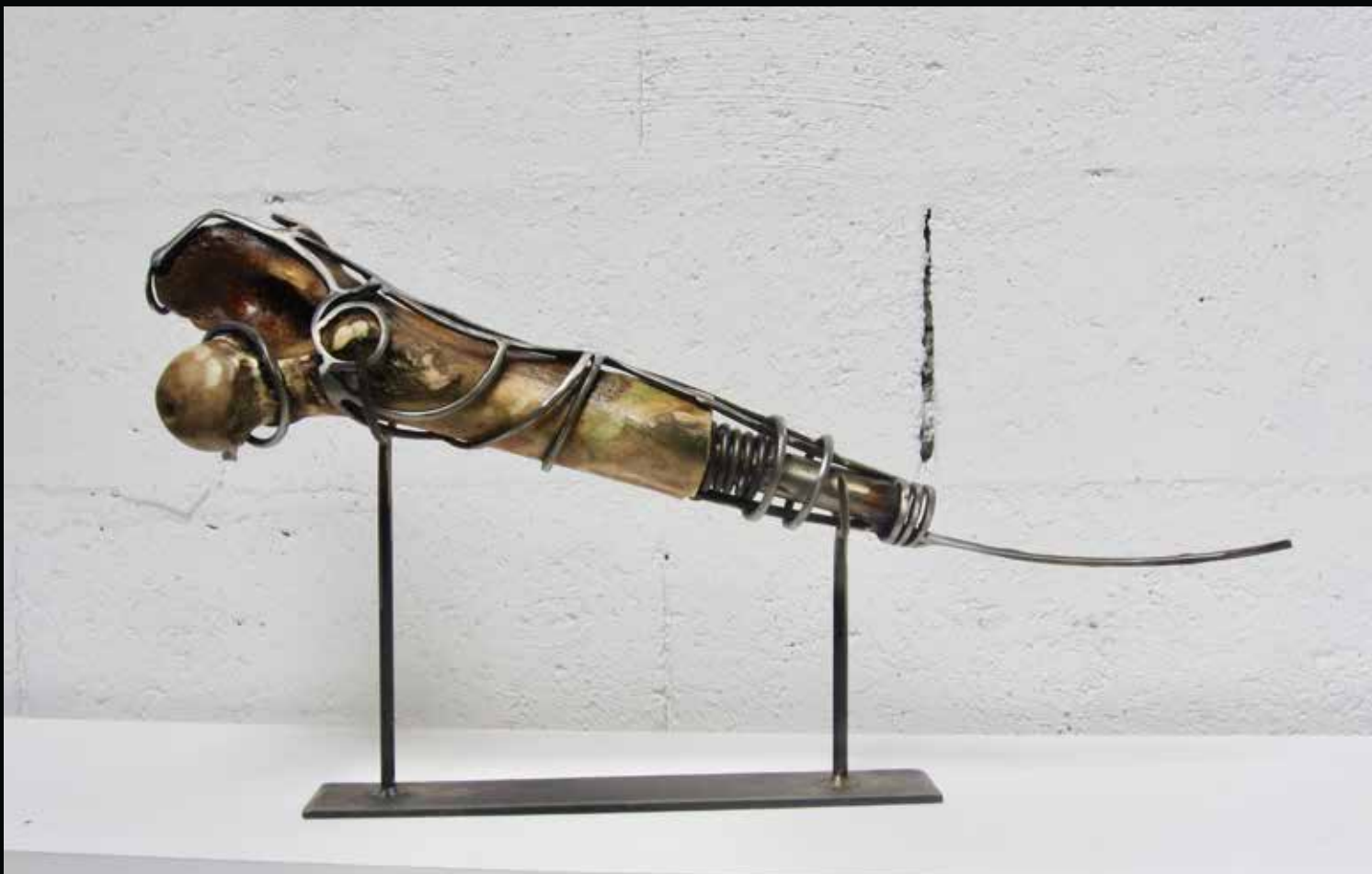
Fémur, 2017 Os, métal h: 36,8, l: 18 cm L: 64 cm